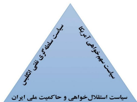
شکل (۱). مثلث مطالبات سه‌گانه در دیپلماسی مذاکرات نفت

آیزنهاور رئیس‌جمهور آمریکا هم حسن‌نیت چندانی از خود نشان نمی‌داد. وی در نامه‌ای از مصدق رسماً خواسته است که پرداخت گرامت عدم‌النفع را به انگلستان بپردازد و در جواب درخواست کمک مصدق هم نوشته بود امیدوارم تا فرصت باقی است برای جلوگیری از بدتر شدن وضع کنونی کوشش‌هایی در حدود قدرت خود به عمل آورد. اما در همین موقع کرومیت روزولت پس از سفر به اروپا و ملاقات با اشرف خواهر شاه عملاً کار کودتا را آغاز کرده بود و مصدق با نامه آیزنهاور دریافت بود که ماه‌عسل او با آمریکا به پایان رسیده و چاره‌ای جز مقاومت و ادامه مبارزه ندارد و یا باید رهبری نهضت را رها کند (بهنود، ۱۳۶۹: ۳۷۳). آیزنهاور و برادران دالس در تجارت بین‌الملل مصرانه پشتیبان منافع کسب و کار در آمریکا بودند و توافق نهایی که در سال ۱۳۳۳/۱۹۵۴ با دولت زاهدی امضاء شد، ۴۰ درصد از سهم تولید نفت را به شرکت‌های آمریکایی واگذار نمود (گازیوروسکی، ۱۳۷۱: ۱۴۴) و این غایت سیاست آمریکا در برابر نهضت ملی و مذاکرات نفت بود.