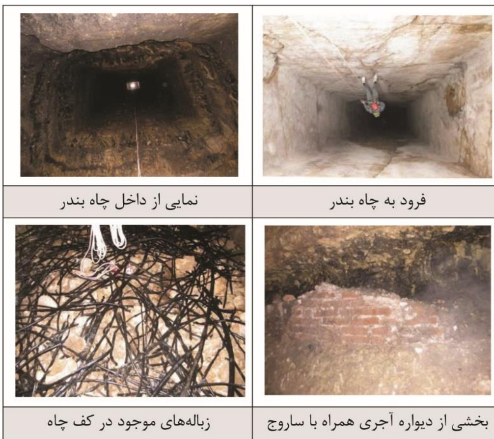
شکل (۹). فرود به چاه بندر و نمایی از فضاهای داخلی و یافته‌های آن (برگرفته از امرله‌هی، ۱۳۹۱)