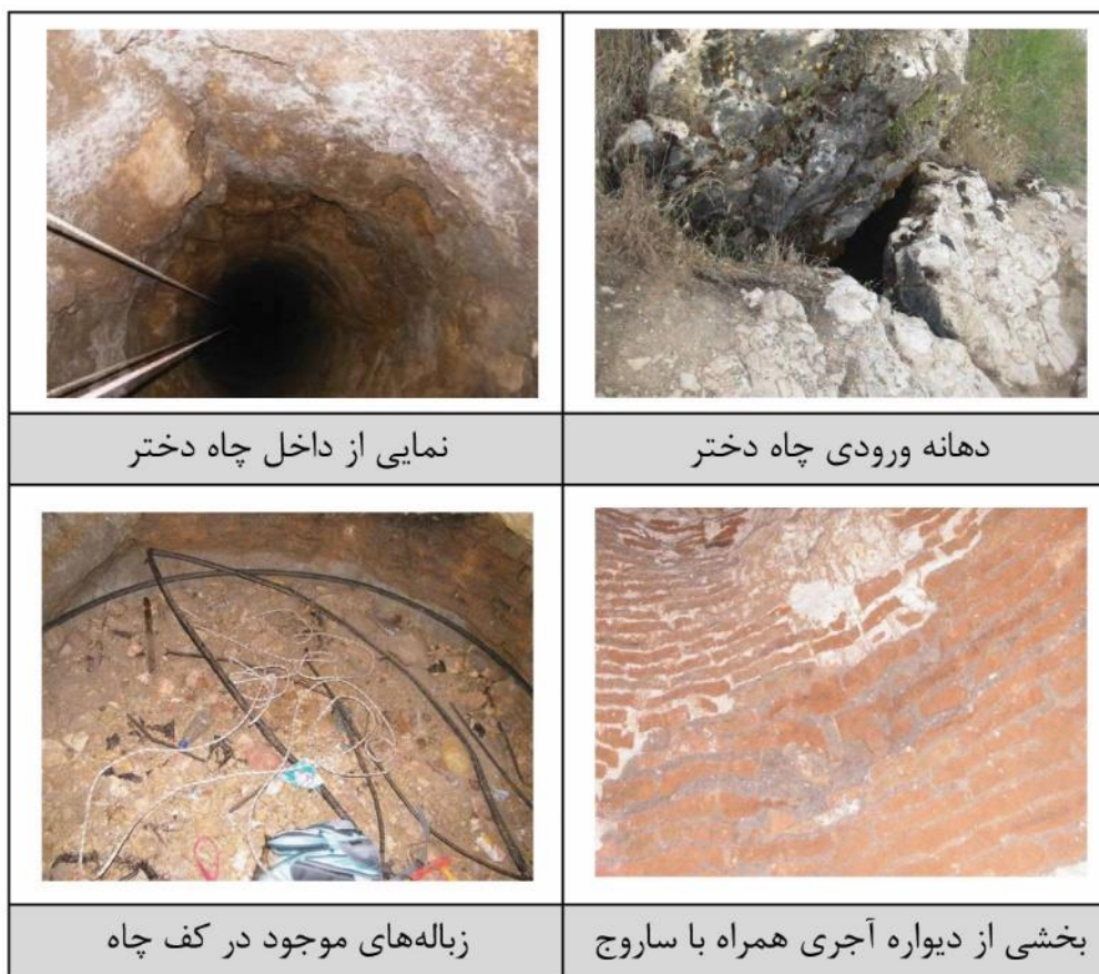
شکل (۱۰). فرود به چاه دختر و نمایی از فضاهای داخلی و یافته‌های آن (برگرفته از امرله‌هی، ۱۳۹۲)