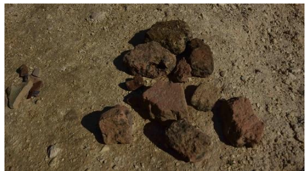
شکل (۱۳). قطعات آجر پراکنده در سطح محوطه (حسینی، ۱۴۰۳)