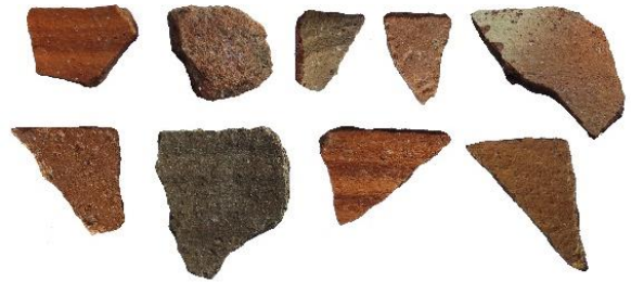
شکل (۱۱). سفال‌هایی با خمیره قرمز، احتمالاً مربوط به دوره ساسانی (حسینی، ۱۴۰۳)

در کنار آثار سفالی می‌توان به قطعات مختلف آجر اشاره کرد که در بخش‌های گوناگون پراکنده شده و با توجه به ساختار آجری قلعه می‌توان آن‌ها را مربوط به دیوارهای بنای مذکور دانست که در سالیان مختلف تخریب شده و در سطح محوطه پراکنده شده‌اند (شکل‌های (۱۱) تا (۱۳)).