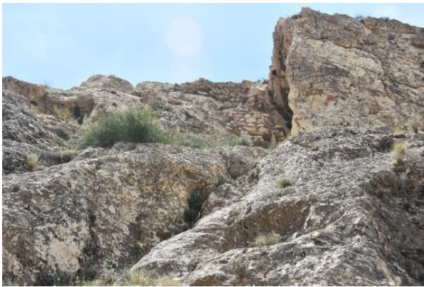
شکل (۷). دیواره‌های سنگ و ساروج قلعه فهندژ، دید به سمت شرق (حسینی، ۱۴۰۳)