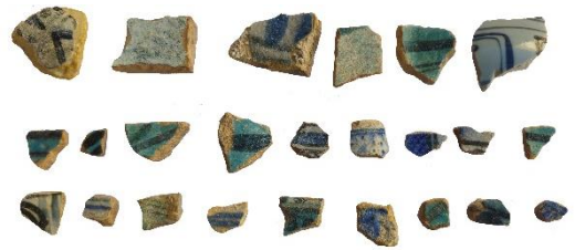
شکل (۱۲). سفال‌های اسلامی قلعه فهندژ (حسینی، ۱۴۰۳)