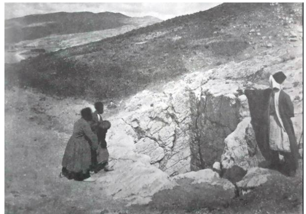
شکل (۱۴). اعدام یک محکوم در دوره قاجار با پرتاب به درون چاه قلعه بندر

در دوره قاجار از چاه‌های قلعه بندر برای اعدام مجرمین استفاده می‌گردید و در برخی از منابع دوره قاجار نیز به این موضوع اشاره می‌شود؛ با این وجود هیچ‌گونه شواهدی که بیان‌کننده این‌گونه از اعدام باشد در بازدیدهای صورت‌گرفته به‌دست نیامد. البته از این نکته نباید غافل بود که ممکن است به مرور زمان استخوان‌ها در زیر لایه‌هایی از خاک که در طی سالیان مختلف وارد فضای داخلی چاه شده مدفون شده‌اند. به همین منظور ساماندهی و انجام کاوش‌های باستان‌شناختی در فضای داخلی چاه‌ها می‌تواند تا حد زیادی به روشن شدن این موضوع کمک کند (شکل (۱۴)).