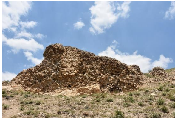
شکل (۹). دیواره سنگ و ساروج قلعه فهندژ، دید به سمت غرب (حسینی، ۱۴۰۳)

نمونه‌های مختلفی از آن در مکان‌هایی همچون در بیشاپور و بندر سیراف شناسایی شده است (احمدی و همکاران، ۱۴۰۲: ۳۴۳).