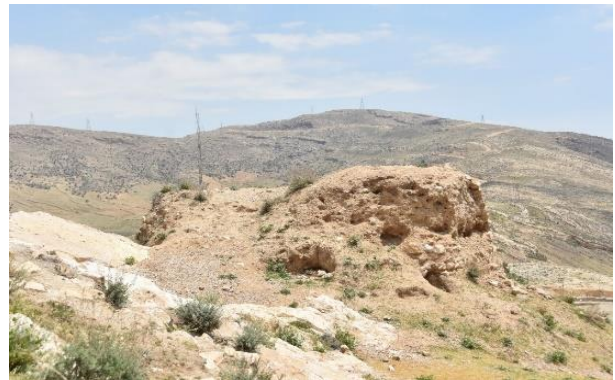
شکل (۳). جبهه شمالی برج شرقی قلعه فهندژ (حسینی، ۱۴۰۳)

نمونه‌های مختلفی از آن در مکان‌هایی همچون در بیشاپور و بندر سیراف شناسایی شده است (احمدی و همکاران، ۱۴۰۲: ۳۴۳).