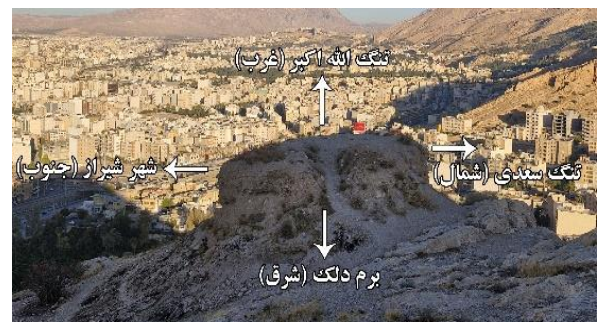
شکل (۶). موقعیت برج غربی نسبت به مکان‌های مهم (حسینی، ۱۴۰۳)