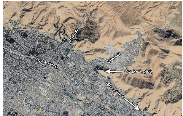
شکل (۱). محدوده تقریبی قلعه بر روی عکس هوایی

بنای قلعه بَندر در جهت شرقی باغ دلگشا و بر روی کوهی به نام فِه‌ندژ مشرف به شهر شیراز و در مختصات جغرافیایی ۲۹ درجه و ۳۷ دقیقه ۵ ثانیه طول جغرافیایی و ۵۲ درجه و ۳۴ دقیقه و ۴۱ ثانیه عرض جغرافیایی واقع شده است (شکل‌های (۱) و (۲)).