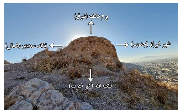
شکل (۵). برج شرقی نسبت به مکان‌های مهم (حسینی، ۱۴۰۳)

در سال ۱۳۹۲ نیز گروه کوهنوردی اقدام به بازدید از چاه دختر نمود. این چاه دارای دهانه دایره‌ای شکل بوده و بازدید از آن نشان داد که عمق امروزی آن در حدود ۱۴۰ متر است اما به دلیل وجود آوار در انتهای آن، می‌توان عمق بیشتری را برای آن تصور نمود. از شواهدی که در این چاه مشاهده می‌شود وجود چندین طاقچه برای گذاشتن ابزارها و وسایل روشنایی و وجود دیواره‌های آجر و ساروج است که در برخی از نقاط دیوار چاه برای جلوگیری از ریزش بدنه سست ایجاد شده‌اند (امراللهی، ۱۳۹۲) (شکل (۹)).